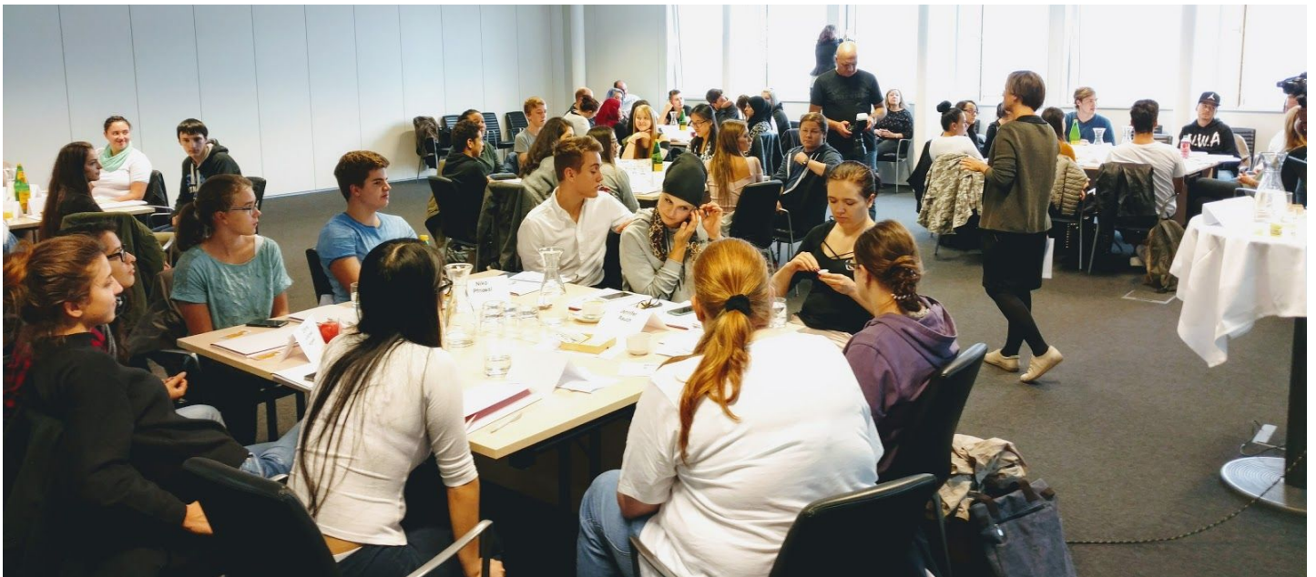
neuwal Elefantenrunde im Österreichischen Parlament zur Nationalratswahl 2017 (Oktober 2017)